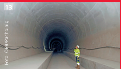
8 Visualisierung Bahnhof Lavanttal* 9 Tunnelbauarbeiten 10 Jauntalbrücke 11 Infobox Kühnsdorf (Außenansicht) 12 Visualisierung Bahnhof Kühnsdorf 13 Granitzaltunnel 14 Infobox Mitterpichling (Innenansicht) 15 Archäologische Ausgrabungen im Lavanttal 16 die neue Drauerquerung 17 Railjet 18 Grafik des Baltisch-Adriatischen Korridors *Projektname