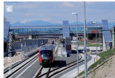
1. Draubridge 2. Radweg bei St. Paul im Lavanttal 3. die künftige Haltestelle Wiederdorf-Aich 5. Haltestelle Klagenfurt-Ebenthal 6. Bahnhof Grafenstein 7. Radtransport mit der Drauschiffahrt